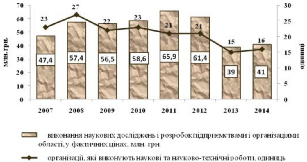
Рис. 1 Динаміка обсягів виконання наукових досліджень і розробок

роком обсяги виконаних наукових досліджень та розробок підприємствами і організаціями децр збільшилися (рис. 1).